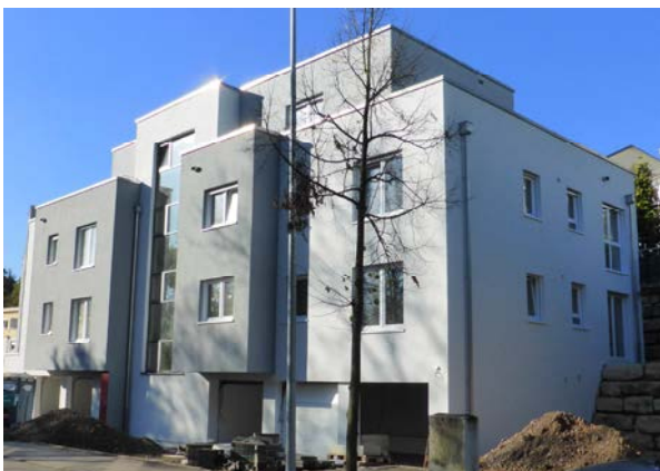
Steinhäusle 38 in Winnenden-Schelmenholz